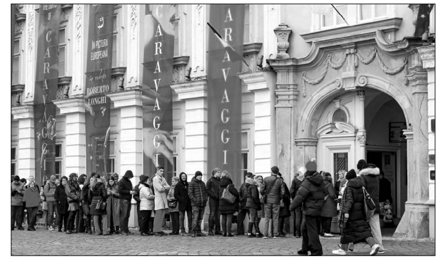
Roma, sub Înaltul Patronaj al Ministerelor Culturii din România și Italia, principalul finanțator fiind CJ Timiș.

Întreg demersul a putut fi realizat cu sprijinul Fondazione di Studi di Storia dell'Arte Roberto Longhi din Florența și Civita Mostre e Musei din