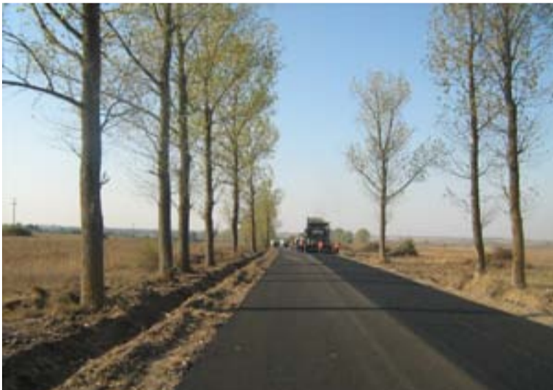
Strada nouă din Nițchidorf

Ioan Mascovescu: Nițchidorf a fost înființat în 1785 prin colonizarea șvabilor din provinciile Lorena, Alsacia, Suabia. A fost un sat eminate de etnici germani, ca număr oscilând între 1.000 - 1.300 de locuitori. Au rămas în momentul de față nouă persoane dintre cei de odinioară, deși recensământul confirmă cifra de 20, diferența apărând ca urmare a unor familii provenite de pe Timișoara. La nivel de comună, se întreține legătura cu cei plecați, organizându-se la 2-3 ani întâlniri ce dau posibilitatea celor plecați de a-și revede casele, cimitirul, biserica, ca puncte care îi leagă în mod special pe cei în vârstă. În ultimii ani, la inițiativa celor plecați, s-a realizat o primă lucrare de reparație