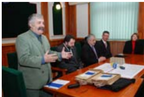
Deschiderea festivă și publică a proiectului „Înapoi la Natură”, la data de 17.01.2012, în Sala Verde a C.J. Timiș