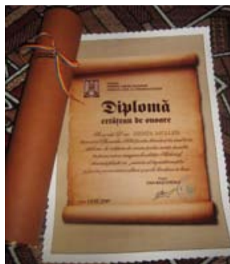
Diplomă acordată de către Comisia Județeană

având în componența delegației „Academia femeilor din Ulm” și reprezentanți ai muzeului din Ulm, intereseți de colaborare și realizare a unor puncte muzeale. În aceeași direcție am primit și vizita unor reprezentanți din conducerea Teatrului German din Timișoara, decizi să pună pe scenă în formă artistică romanul „Ținuturile joase”. Desigur că vor avea toată colaborarea din partea autorității și comunității locale. Sperăm că întâlnirea de la teatru să fie ocazia de înmănare a titlului de „Cetățean de onoare a localității Nițchidorf” doamnei Herta Muller care, se pare, a confirmat participarea la premieră și care pe unul din romanele doamnei „Este sau nu este Ion” a făcut mențiunea „într-o bună zi, voi vizita Nițchidorf și sper a ne întâlni”.